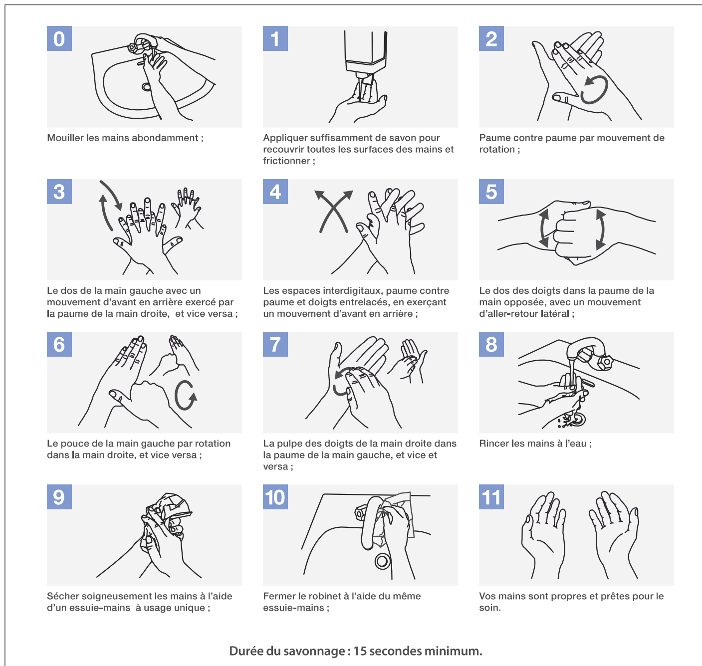
Figure 4 - Schéma de la technique du lavage des mains [8].